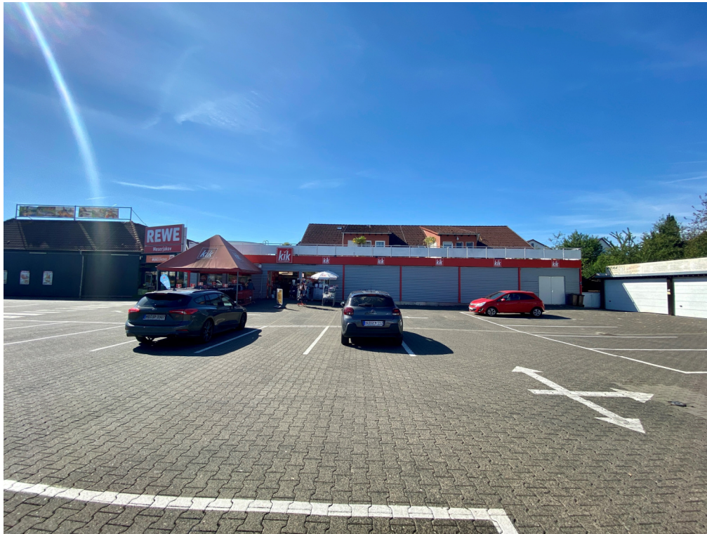
Ansicht mit der Verbindung zum REWE Supermarkt